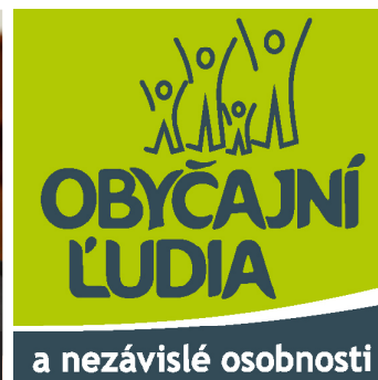
a nezávislé osobnosti